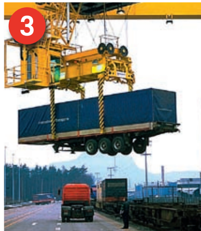
„Unbegleiteter Kombinierte Verkehr“: Hier wird der komplette Sattelaufleger ohne Zugmaschine auf besondere Taschenwagen verladen.