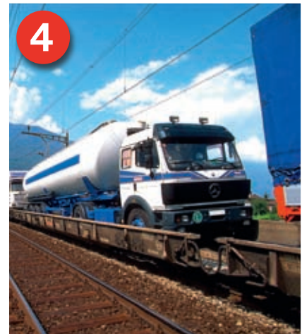
„Rollende Landstraße“: Komplett Straßenfahrzeuge fahren mit eigener Kraft auf spezielle Niederflurwagen der Eisenbahn auf.