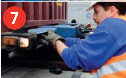
6 Container und Wechselbrücken werden bspw. mit genormten Verriegelungen (z. B. „Twist Locks“) am Trägerfahrzeug gesichert.