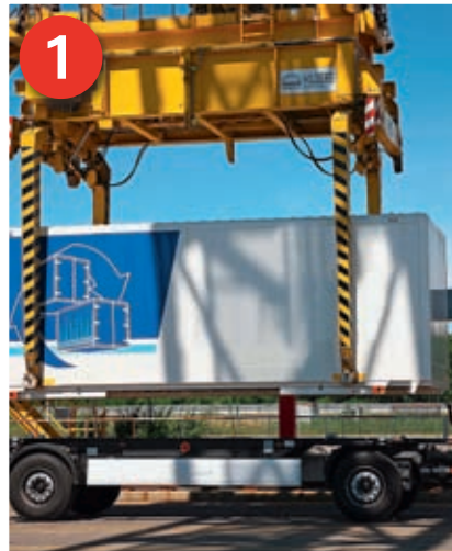
„Huckepackverkehr mit Wechselbehälter (1) oder Container (2)“: Spezielle LKW und Anhänger oder spezielle Sattelanhänger übernehmen die An- und Abfahrt zum und vom Verladeterminale. Der überwiegende Teil des Transportes (Hauptlauf) findet auf der Schiene statt.