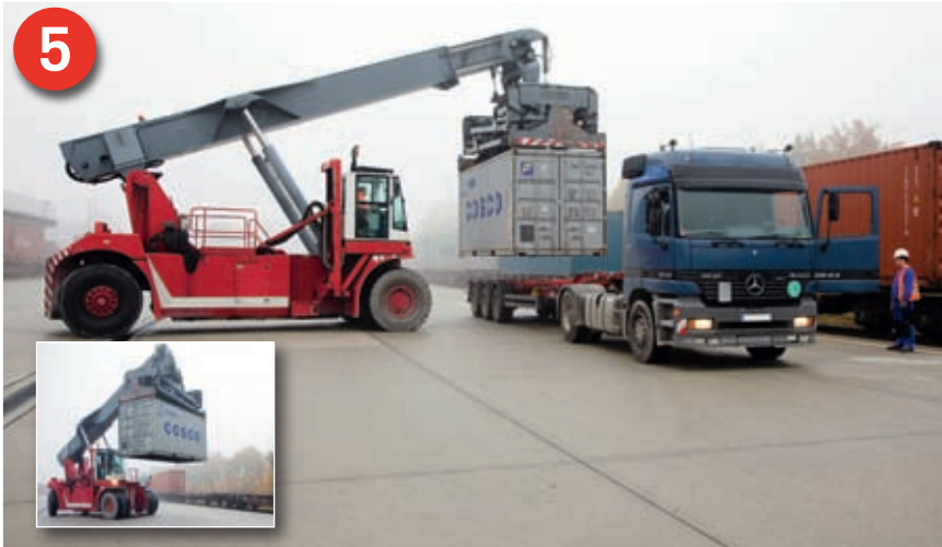
5 Beim KLV (Straßenvorlauf – Bahnhauptlauf – Straßennachlauf) sind die Verladerrichtung der Großladeeinheiten (Container, Wechselbehälter, Sattelaufleger) sowie die Fahrtrichtung der Bahn vorher nicht bekannt. In beide Fahrrichtungen sind je 100% der Gewichtskraft abzusichern.